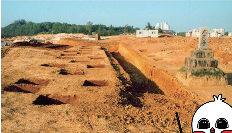
▲ 치평동 구석기 유적지 발굴 현장으로 오른쪽에 상무대 표지석이 보인다.