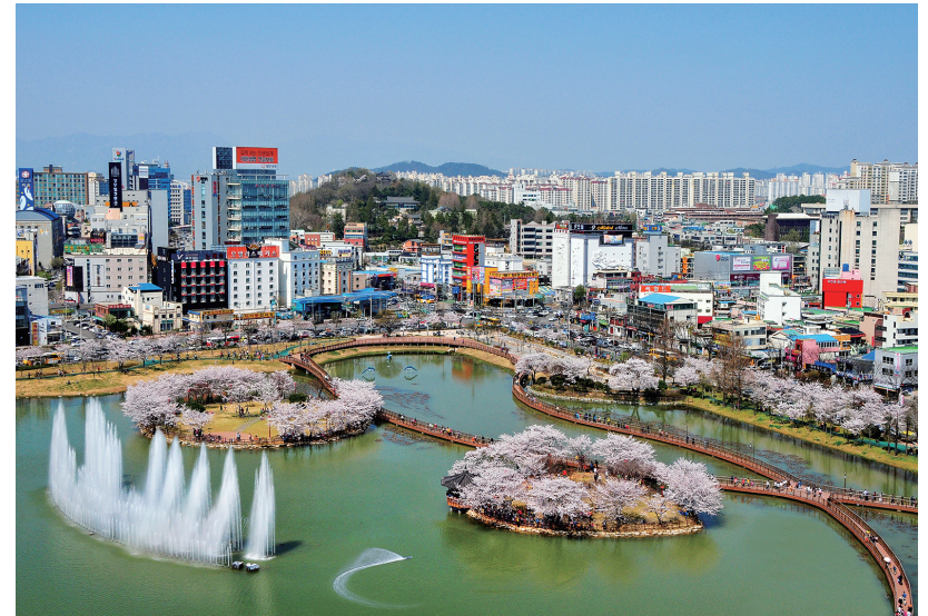
▲ 윤천호수 주변으로 고층아파트가 빼곡이 들어차 있다.

광주 최초의 사람이 살았던 것으로 여겨지는 치평동 유적지는 당시의 몇몇 흔적만 찾아내고 다시 흙으로 덮어졌다. 그 위로 고층 아파트들이 빼곡히 들어섰다. 수 만년이 흐르면서 구석기인의