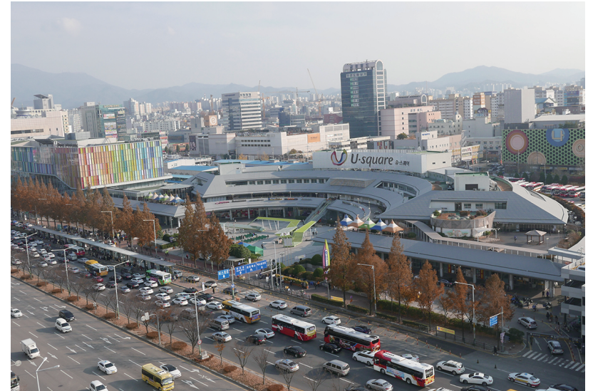
▲ 유스퀘어 광천동 종합버스터미널 주변

인근에는 대형 백화점과 대형마트가 있는가 하면 병원 빌딩 거리가 형성될 정도로 병의원들이 즐비하다. 해운이는 이곳을 생활의 모든 것을 원스톱 쇼핑하며 즐기는 공간이라고 생각한다. 군부대 교육기관이었던 상무대는 장성으로 옮겨지고 그 자리에