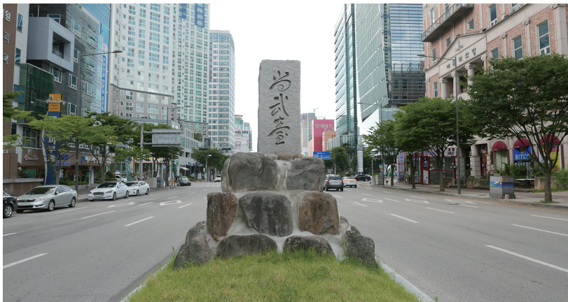
▲ 현재 상무대 표지석

돌칼 같은 것을 만들었다. 그것들은 과일을 따거나 물고기나 동물을 잡는데 유용한 수단이었다. 나뭇잎이나 풀을 으깨고 다지는 데 사용했다.